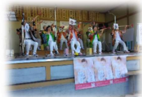
夢弦（スコップ三味線）の様子です

夢弦（スコップ三味線）の演奏や創作活動を行うオープンサロンなど、新光東コスモス会特有の活動も行っています。