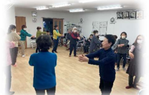
趣味の会の様子です

前身である朝里寿会の解散後、5 年ほど前に「朝里シニアクラブ」に名称変更して発足しました。クラブ活動の他、小樽市老人クラブ連合会の各種行事にも参加しています。会員数は 63 名（令和 5 年 11 月）で、徐々に増加しており、北海道老人クラブ連合会より表彰されました。