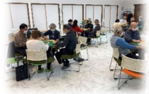
「輝」麻雀の様子です

会員の皆さんが楽しんでクラブ活動を行い、交流の機会が持てることを大切にしています。